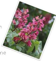
Décoration des fleurs